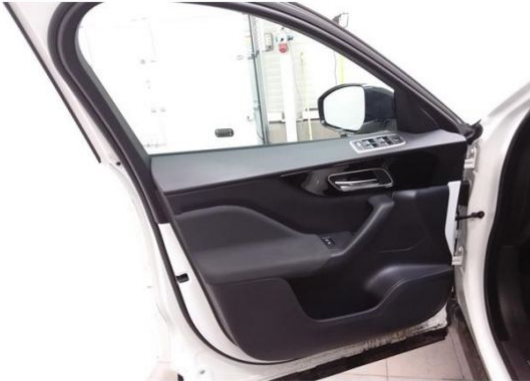
Dveře řidiče vnitřní část