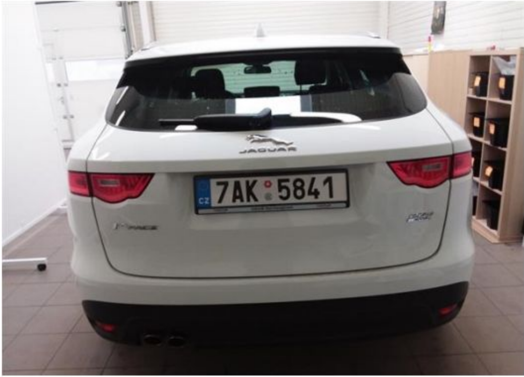
Zadní část vozu