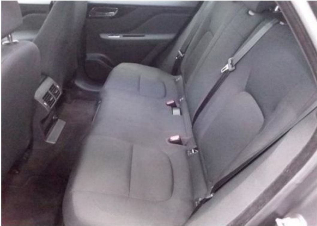
Zadní levé sedadlo