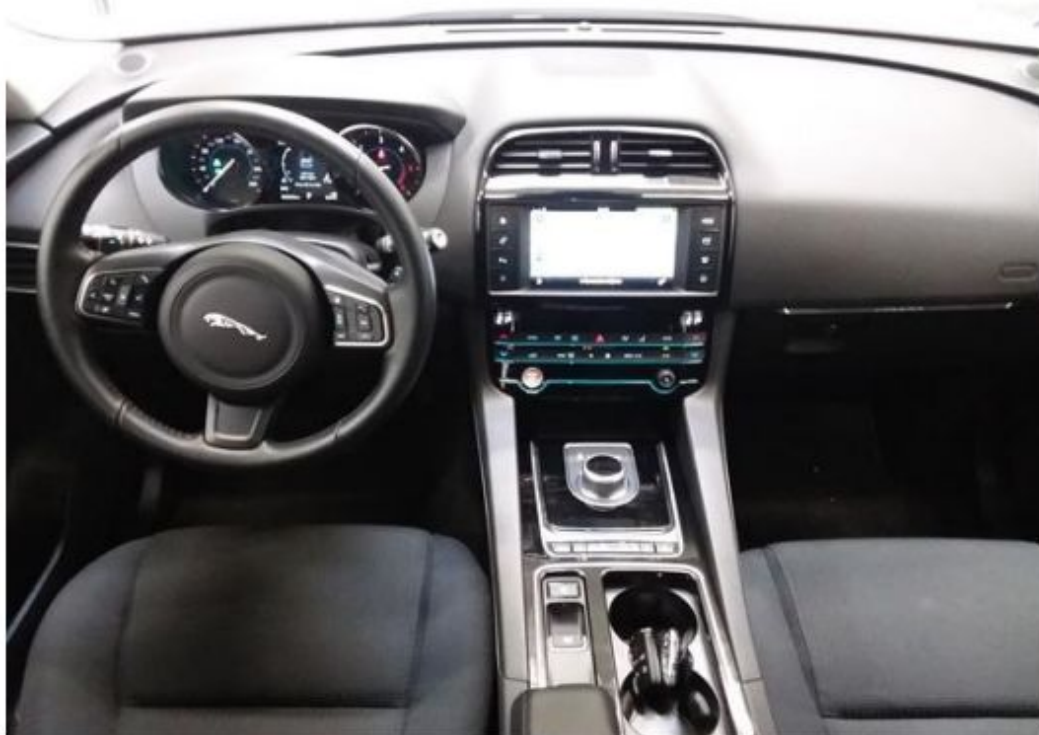
Palubní deska celá