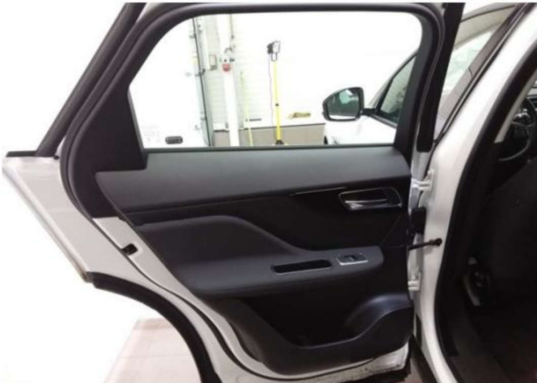
Zadní levé dveře vnitřní část