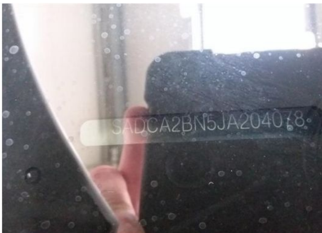
Foto VIN 2