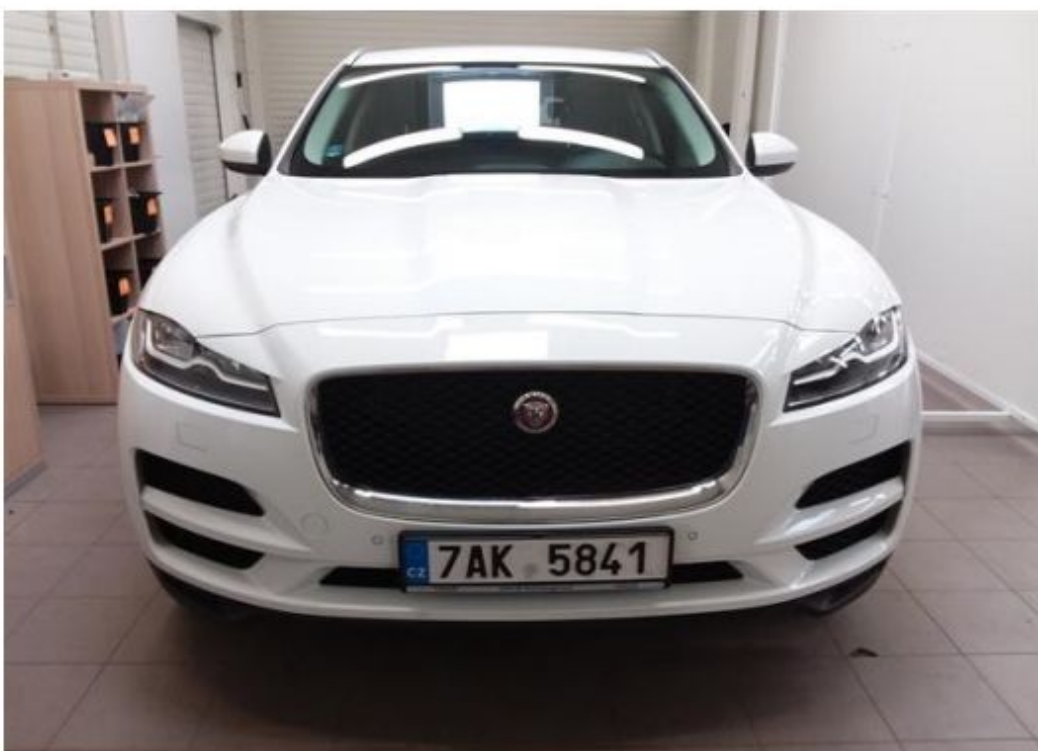
Přední část vozu