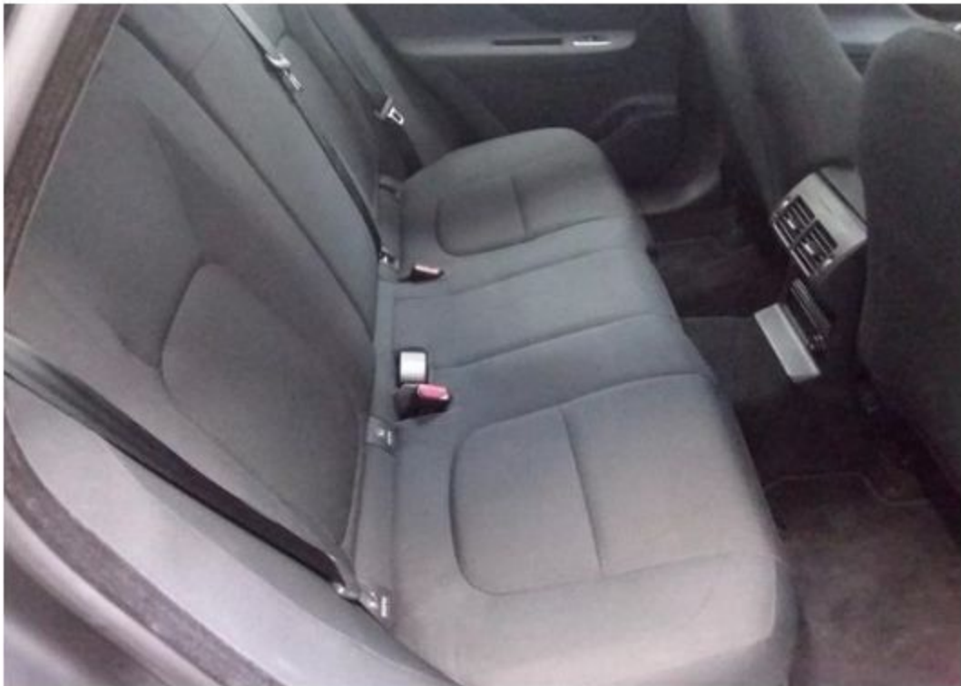
Zadní pravé sedadlo