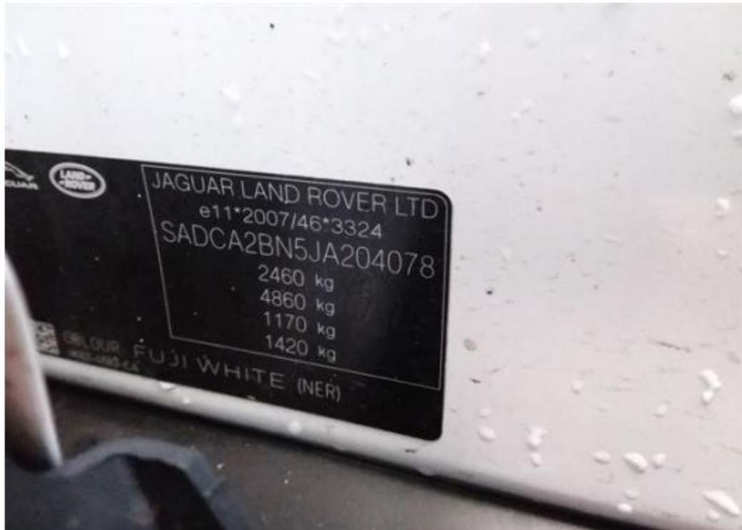
Foto VIN 1