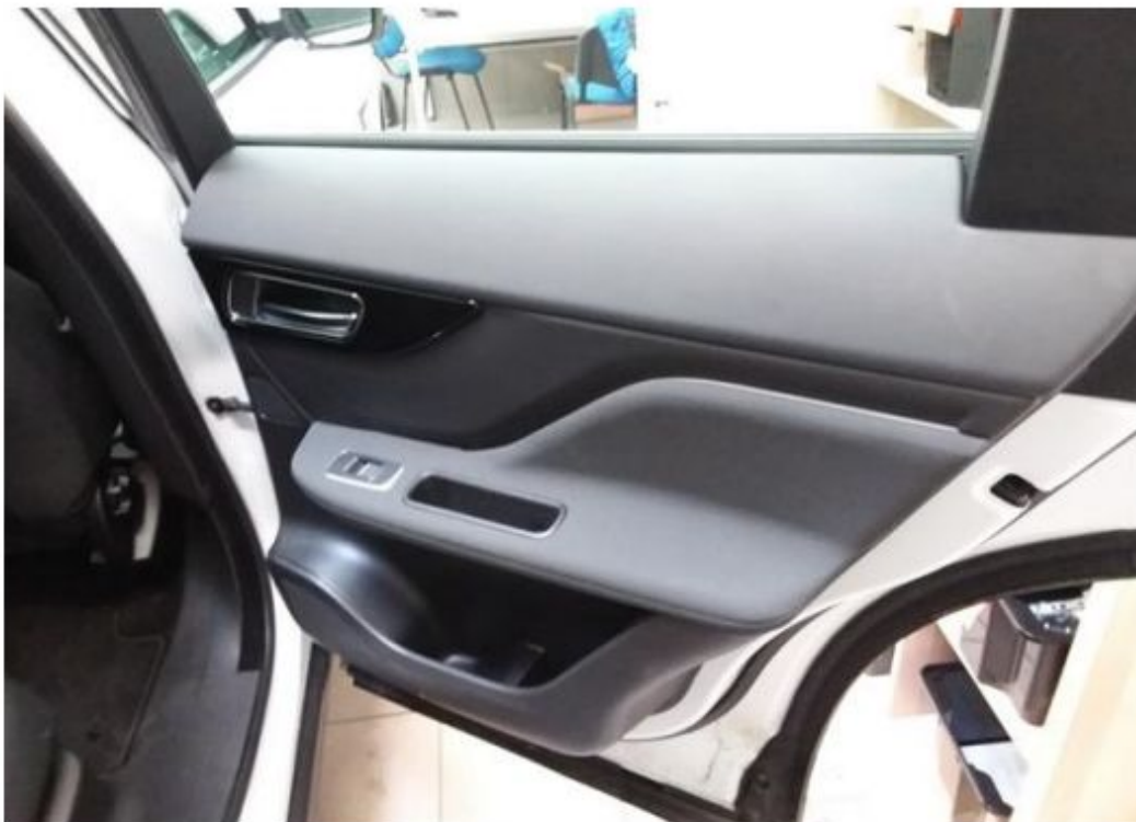
Zadní pravé dveře vnitřní část