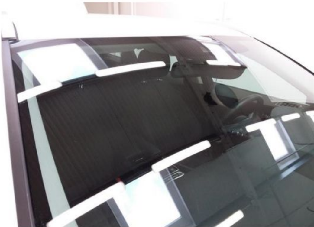
Viz popis k poškození č. 2