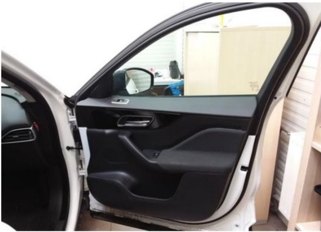
Dveře spolujezdce vnitřní část