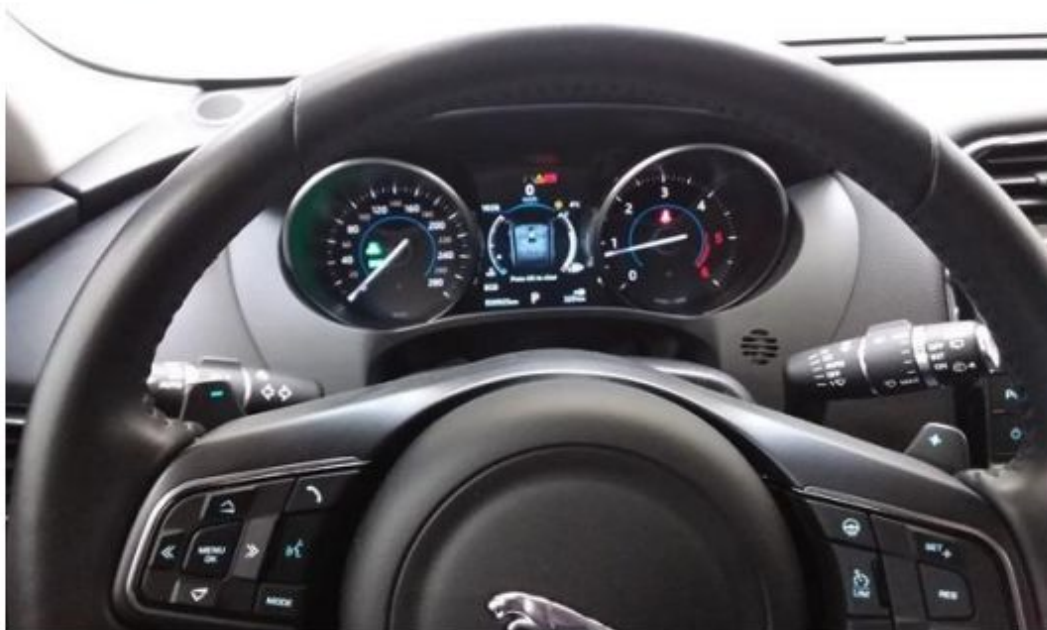
Palubní deska od řidiče