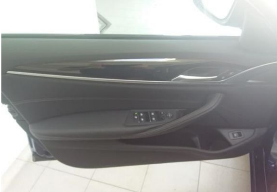
Dveře řidiče vnitřní část