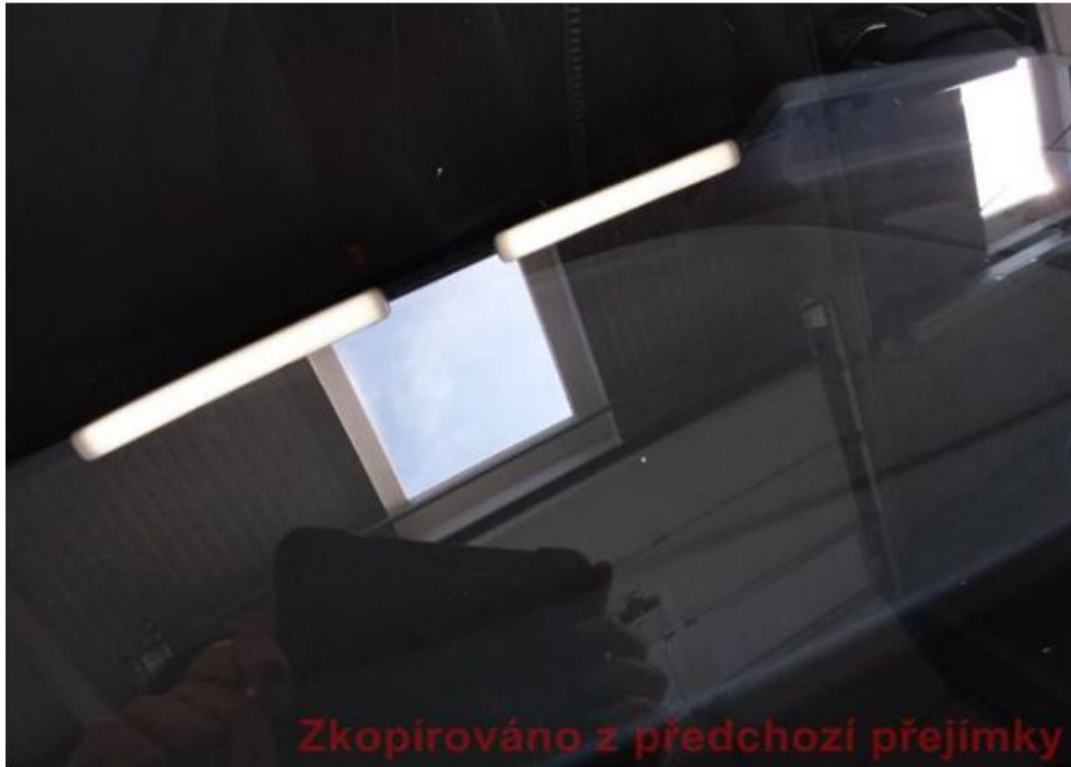
Viz popis k poškození č. 4