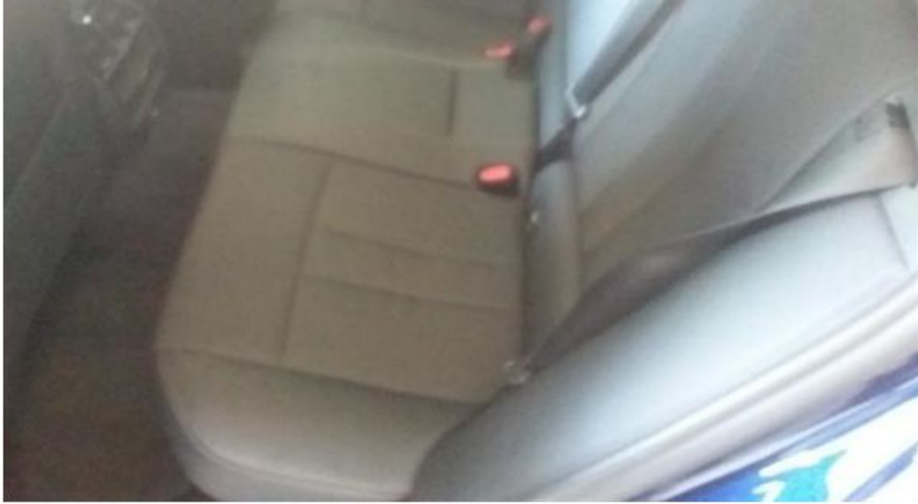
Zadní levé sedadlo