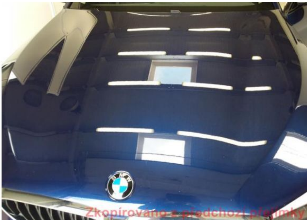
Viz popis k poškození č. 7