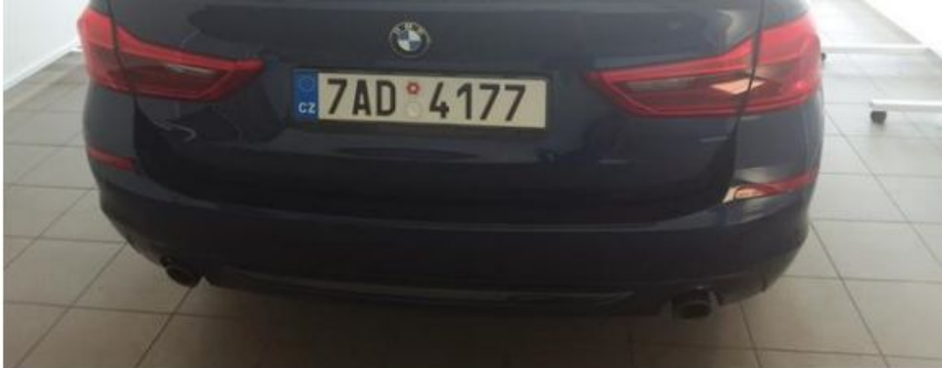
Zadní část vozu