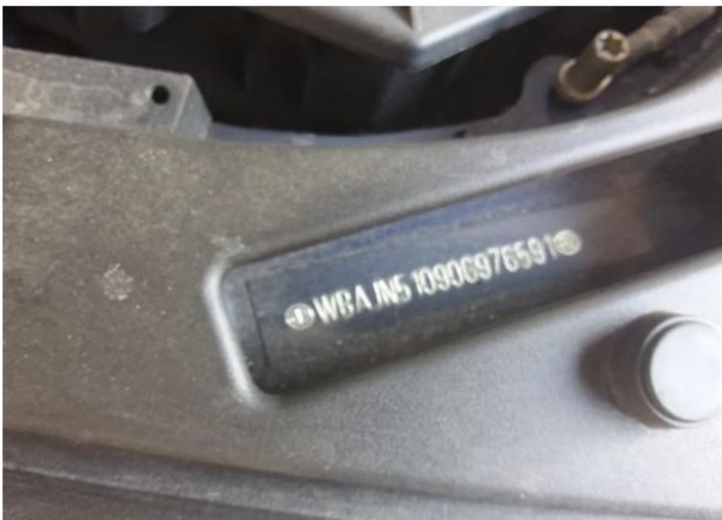
Foto VIN 2