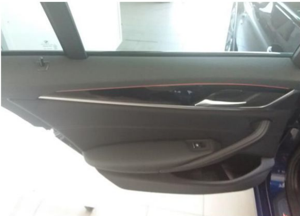
Zadní levé dveře vnitřní část