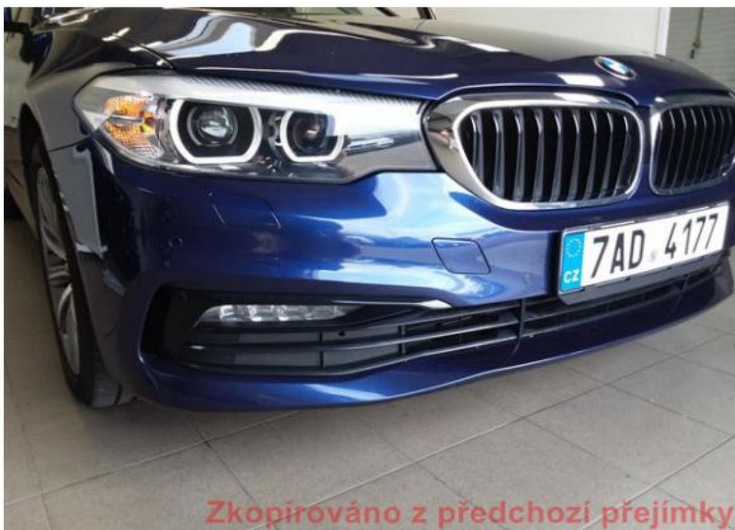
Viz popis k poškození č. 6