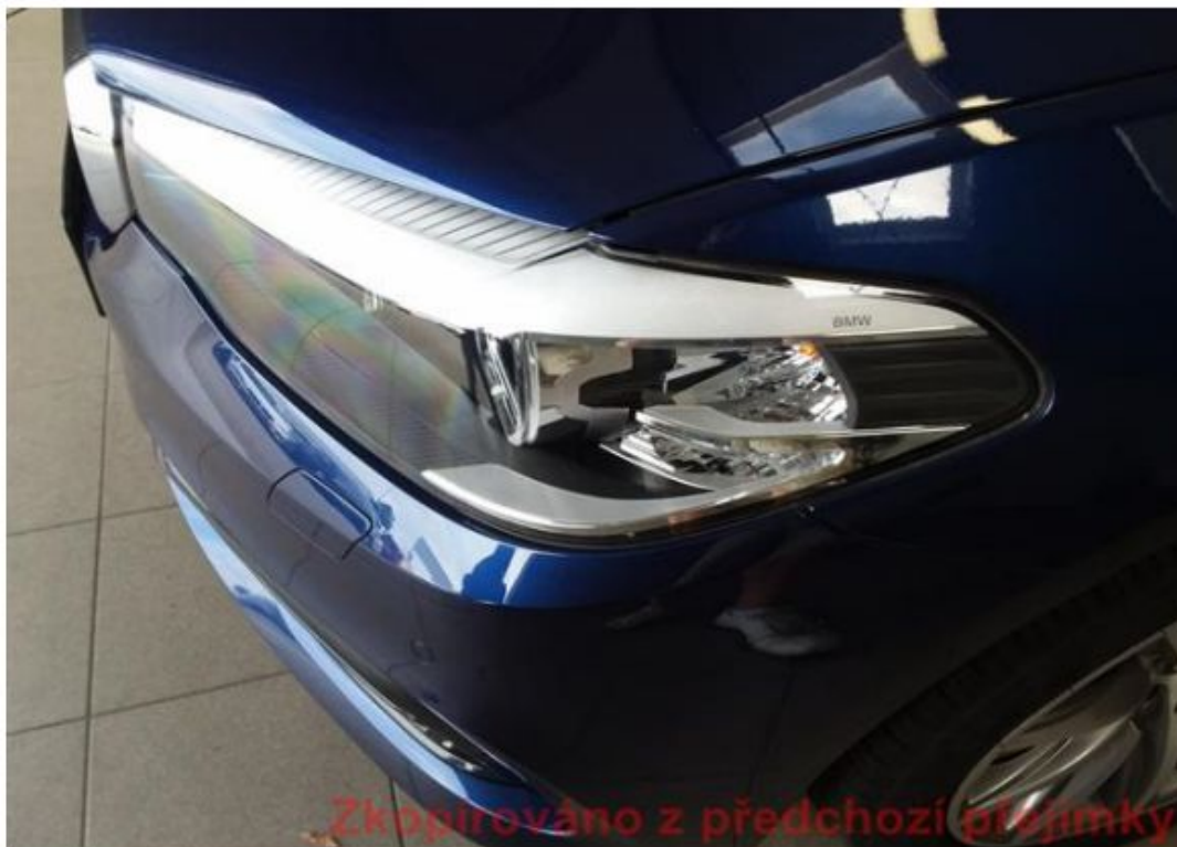
Viz popis k poškození č. 5