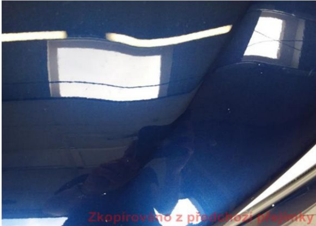
Viz popis k poškození č. 7