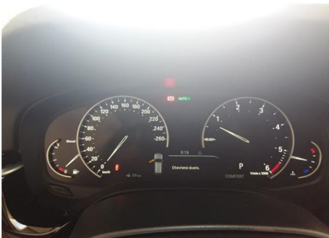
Palubní deska od řidiče