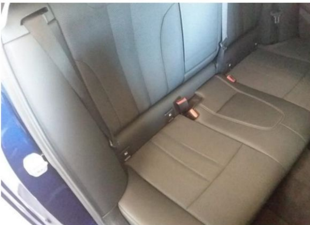
Zadní pravé sedadlo