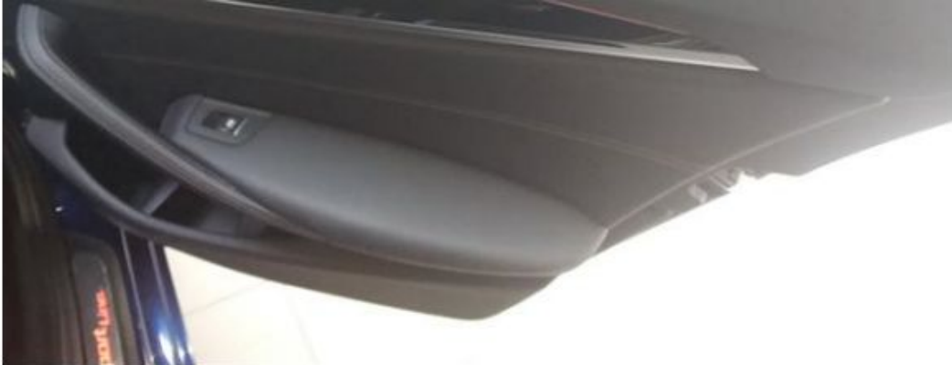
Zadní pravé dveře vnitřní část