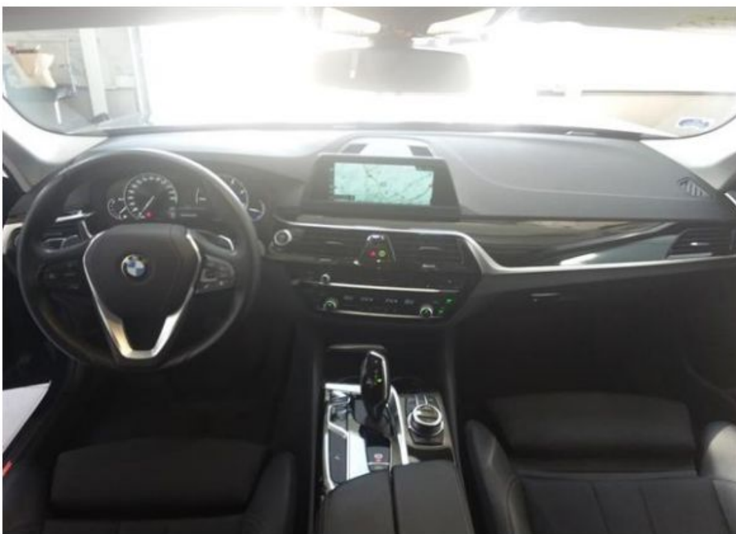
Palubní deska celá