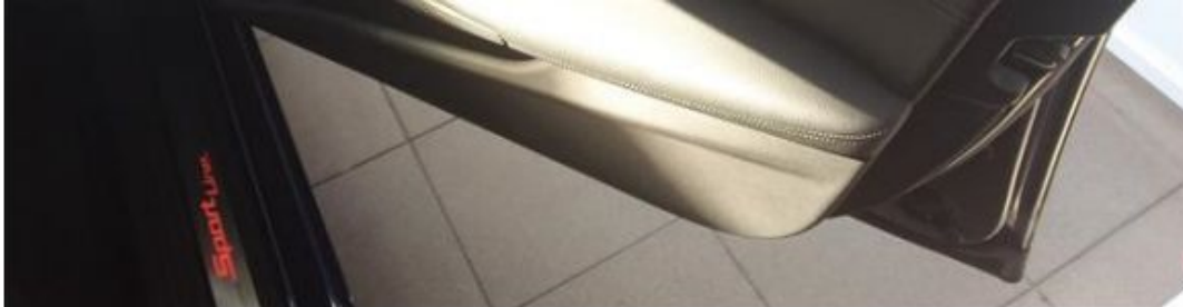
Dveře spolujezdce vnitřní část