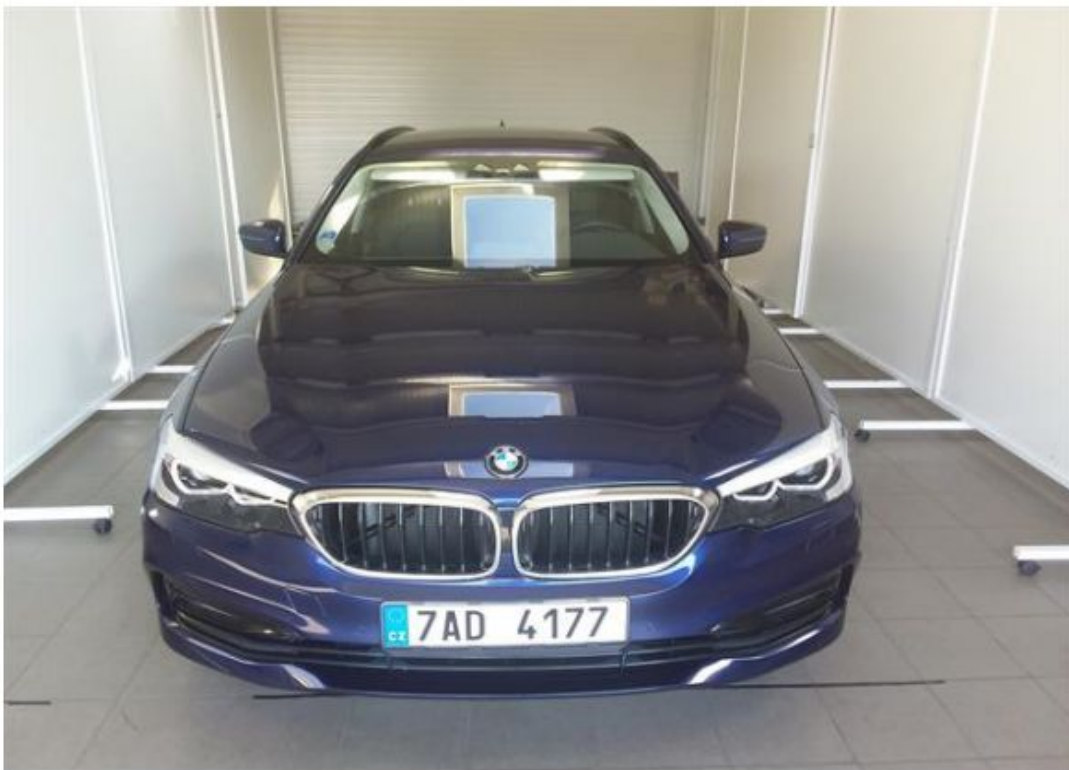
Přední část vozu